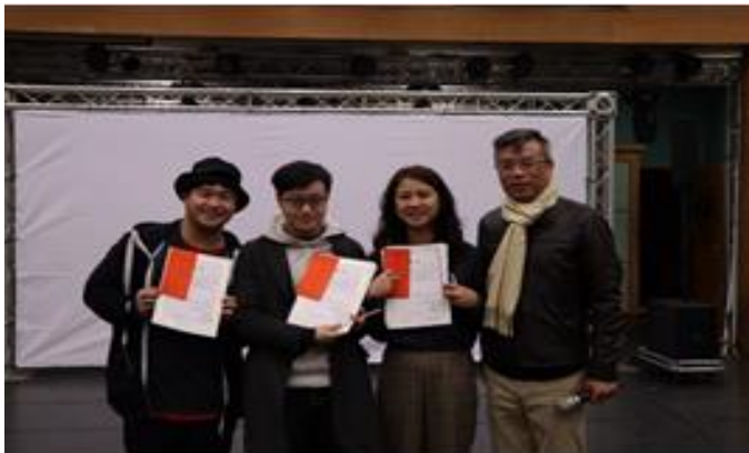
參賽學生與所長合影