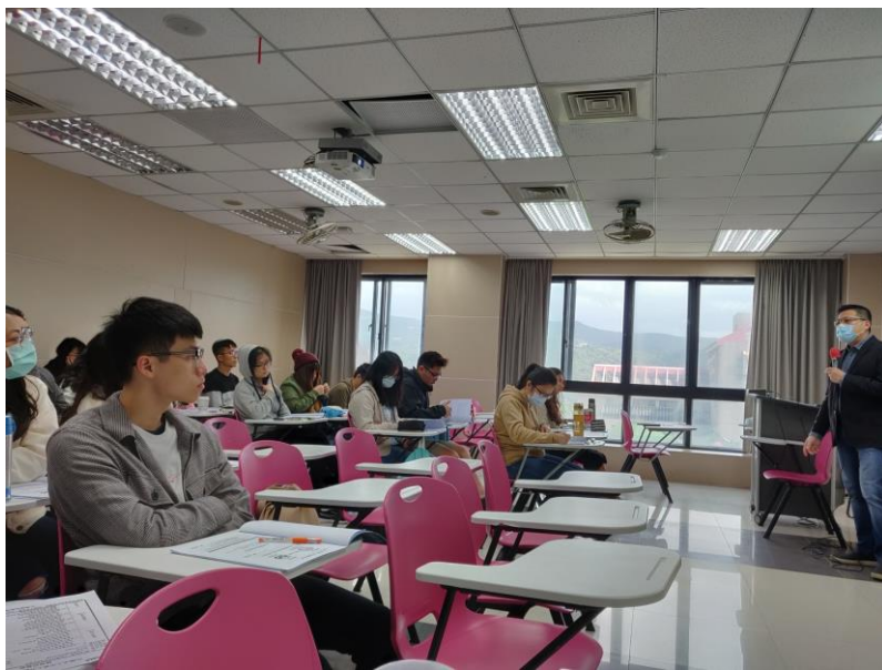
109年10月24日 工作坊實況