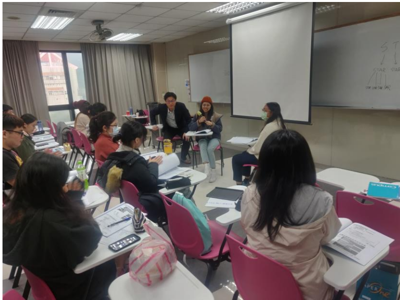
109年10月31日 工作坊實況