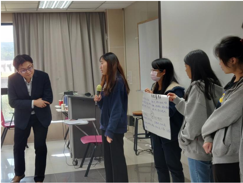
109年10月31日 工作坊實況