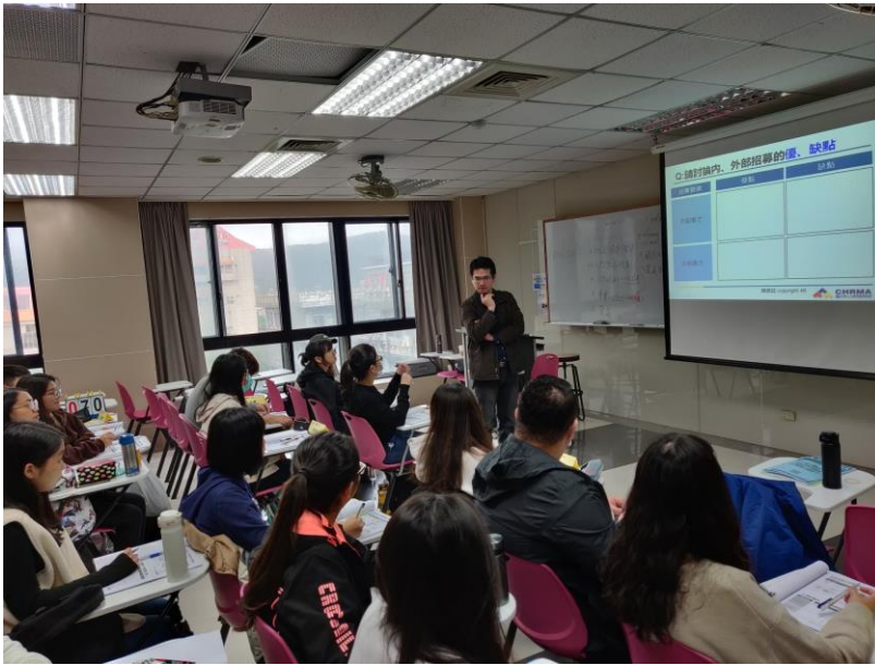
109年10月17日 工作坊實況