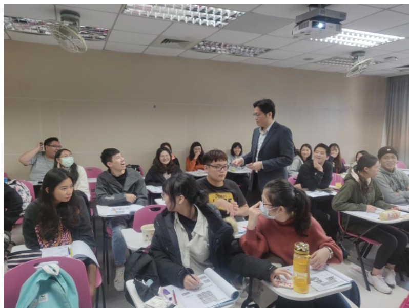
109年10月31日 工作坊實況