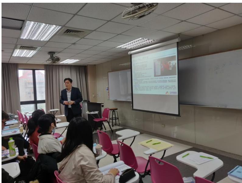
109年10月31日 工作坊實況