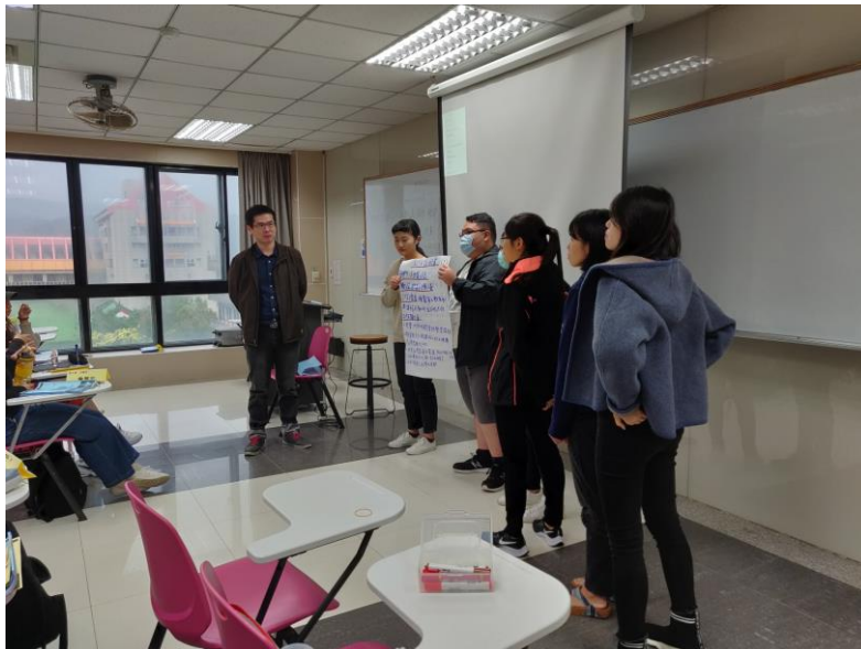
109年10月17日 工作坊實況