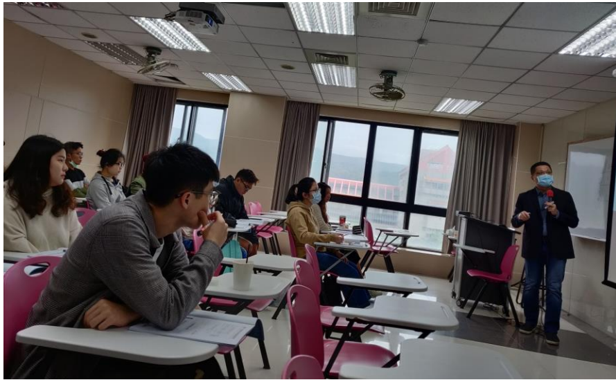
109年10月24日 工作坊實況