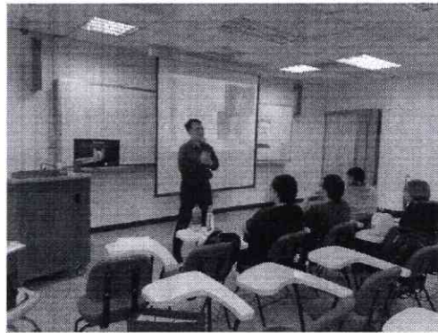
陽明如何影響日本文化