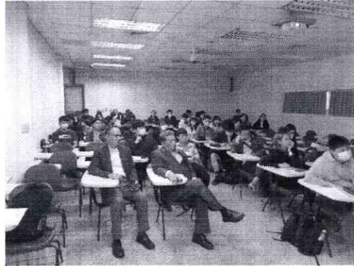
陽明山以前叫草山，是因為王陽明才改陽明山