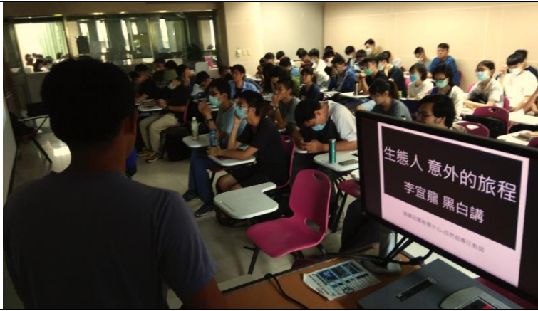
同學聚精會神聽講