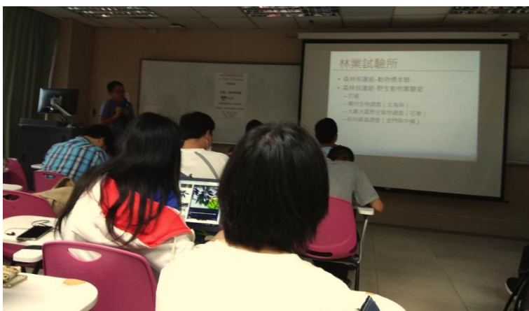
介紹林試所工作經歷