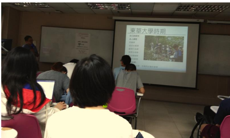
介紹大學時期經歷