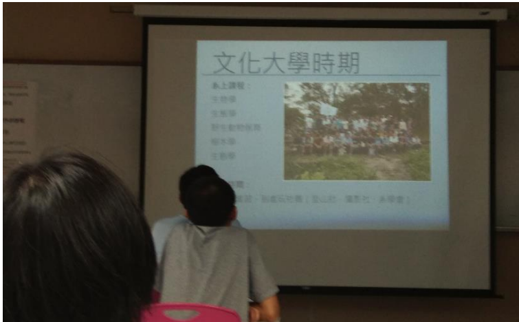
介紹大學時期經歷