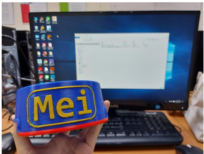
講師帶實作成品讓學員觀看