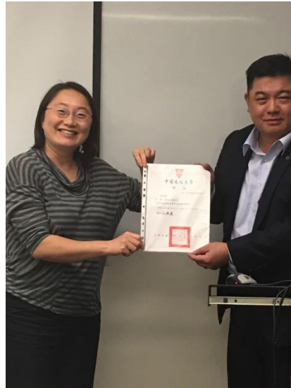
授課教師頒發業師聘書