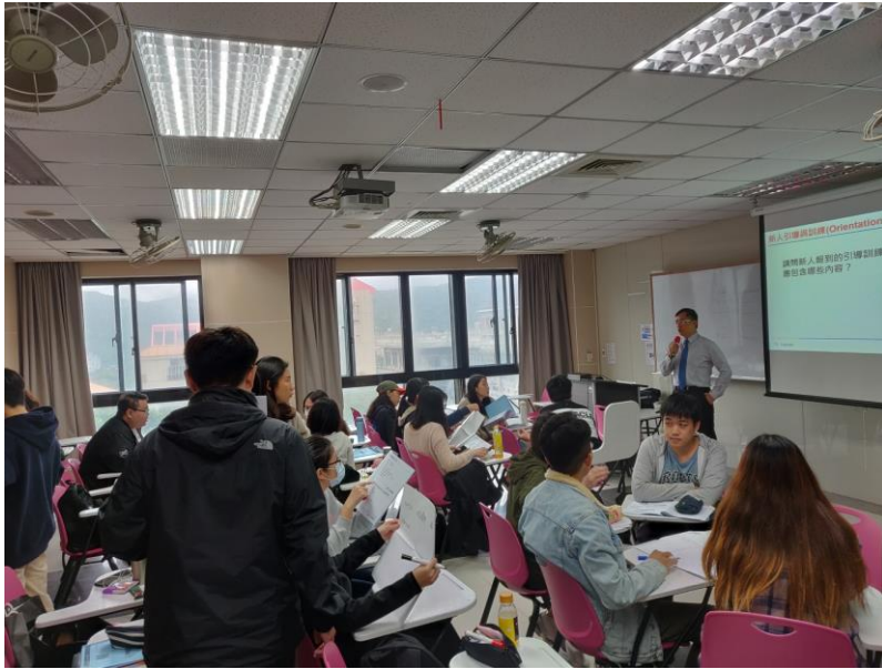
109 年 11 月 7 日 工作坊實況