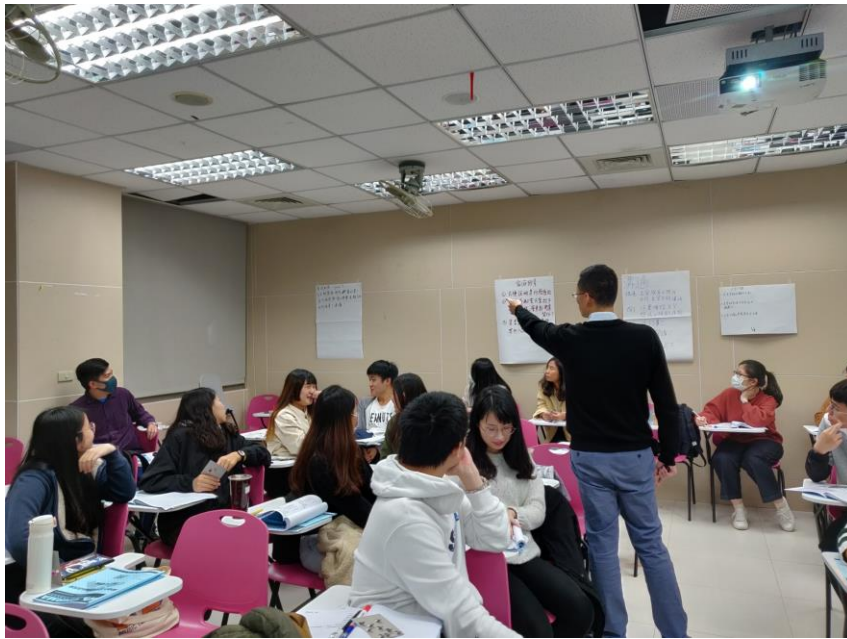
109年11月14日 工作坊實況