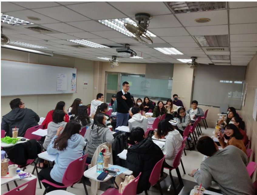
109年11月14日 工作坊實況