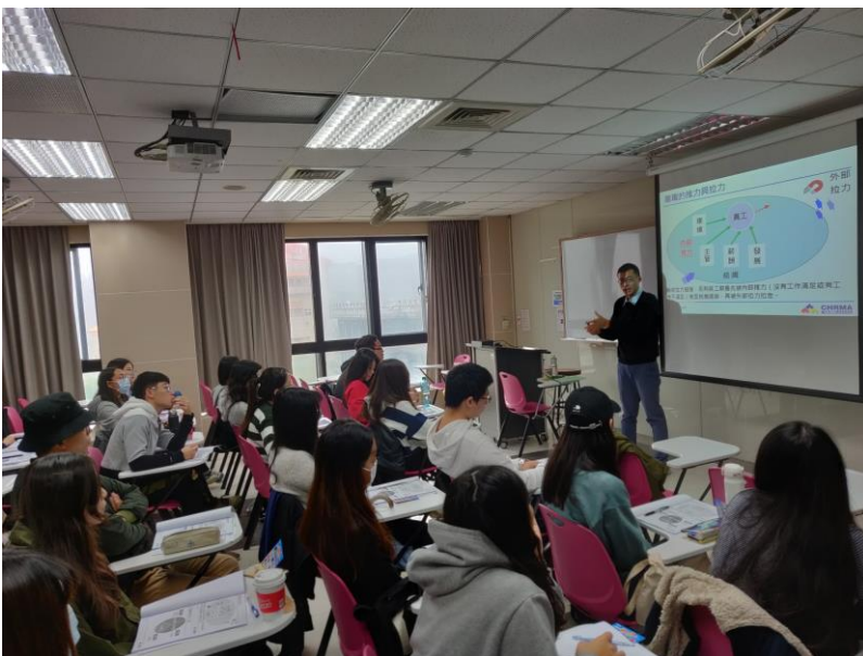
109 年 11 月 14 日 工作坊實況