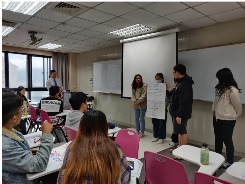
109 年 11 月 7 日 工作坊實況