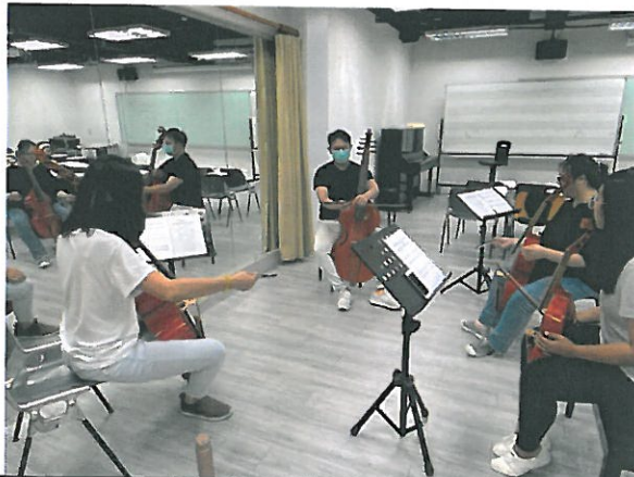
學生學習維奧爾琴拉奏 法