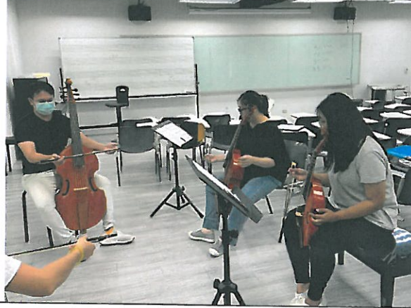
學生學習維奧爾琴拉奏 法