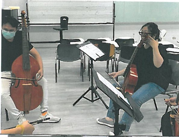
學生學習維奧爾琴拉奏