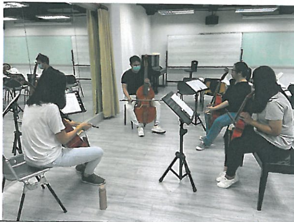
學生學習維奧爾琴拉奏 法