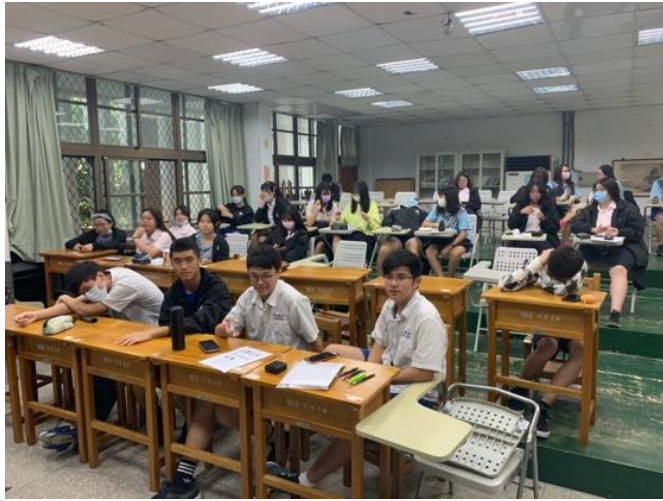
正在聽老師講解的同學們。