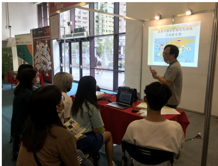
介紹 6 國地理位置