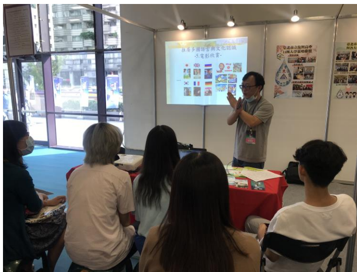
介紹各國特色電影