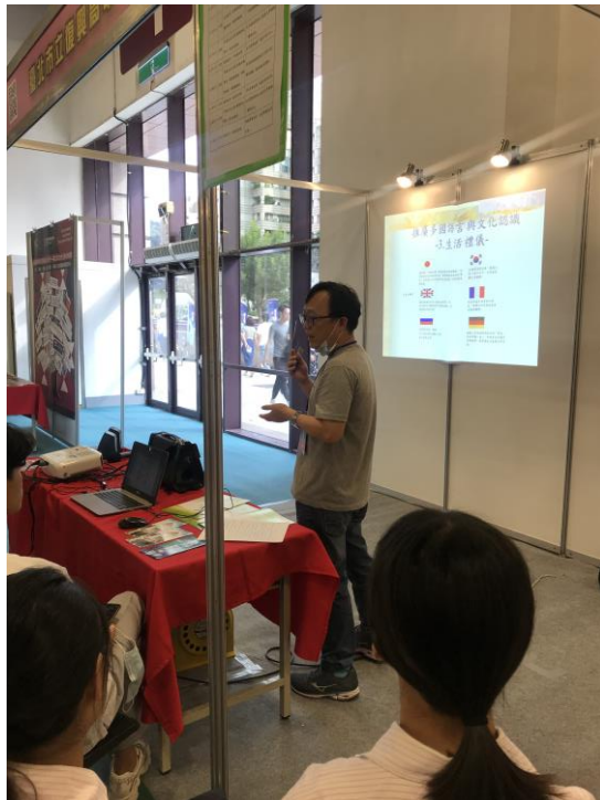
概略講解 6 國文化不同之處