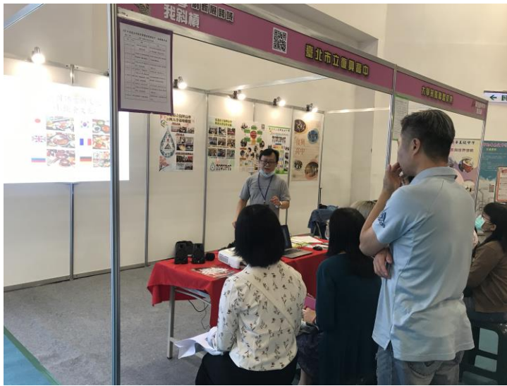
介紹各國特色飲食