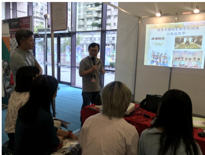
介紹韓國知名歌曲