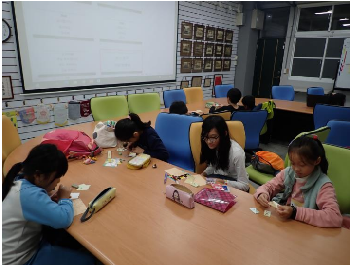
學生們製作感謝卡