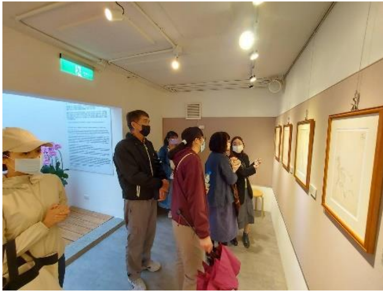
培訓後的同學(右一) 實地上場向觀眾導 覽。