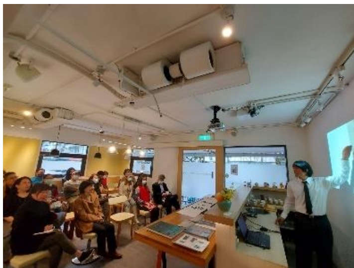
本校美術系洪昌毅主任，12/05(六)15:00 演講：「硯田無惡歲，墨耕有蔬香」—溥心畬蔬菜畫藁賞析