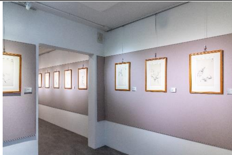
「畫中菜—溥心畬 《蔬菜冊》圖稿展」 展場照