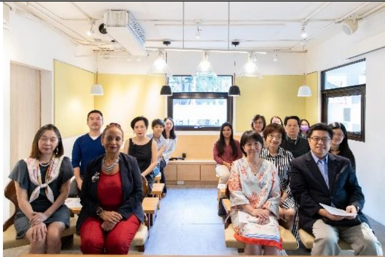
開幕式眾嘉賓合影