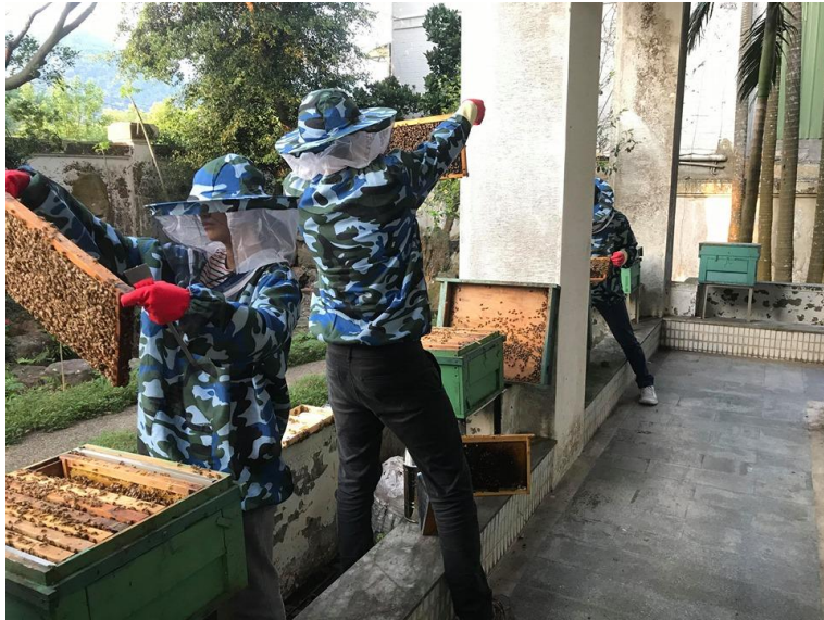
講師帶領觀察蜂巢