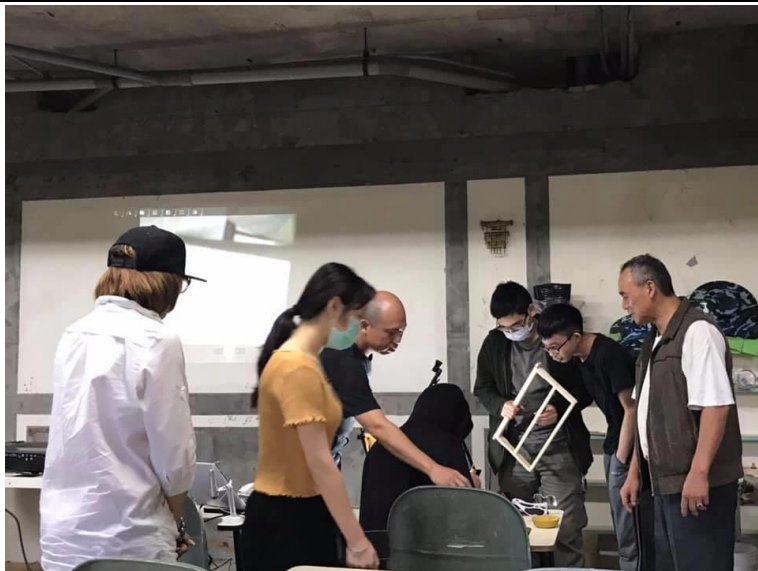
講師講解蜜蜂社會性與組合巢框