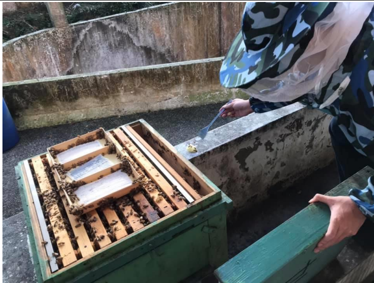
講師講解蜜蜂社會性與組合巢框