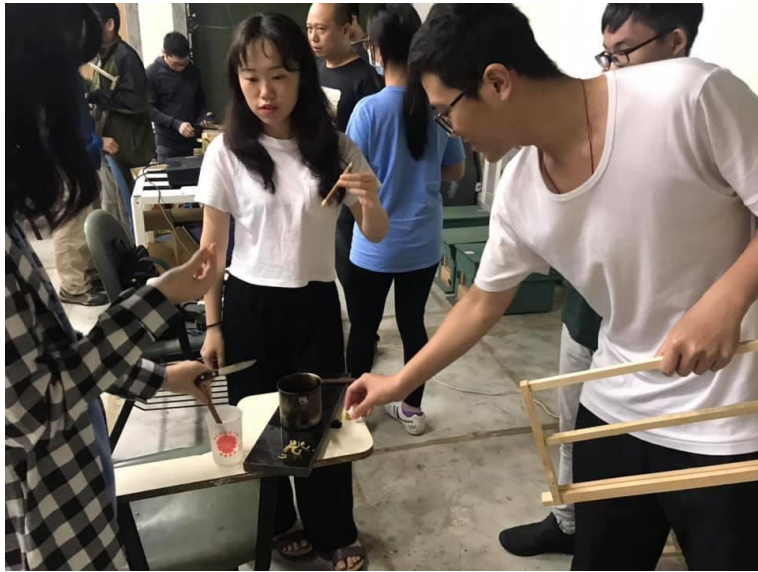
講師帶領觀察蜂巢