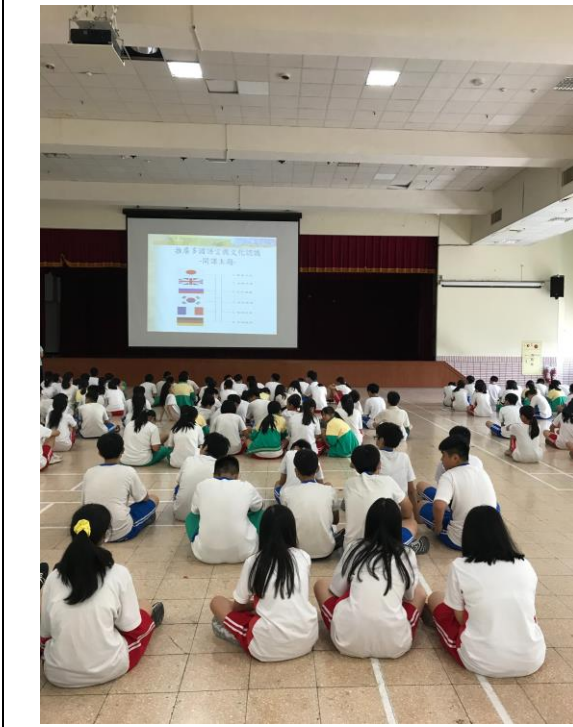
介紹本學期課程大綱