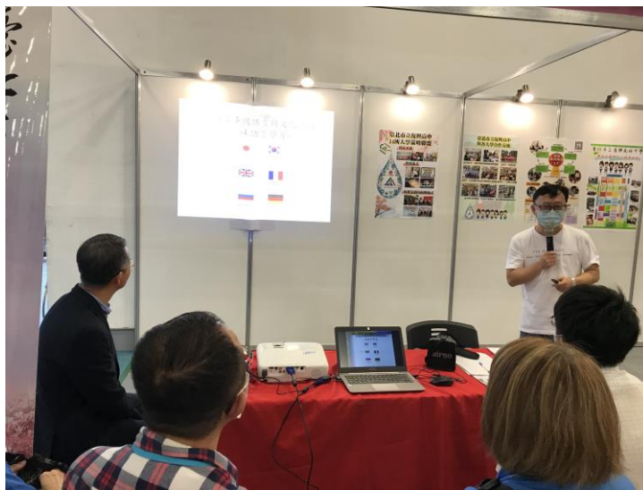
概略講解 6 國文化不同之處