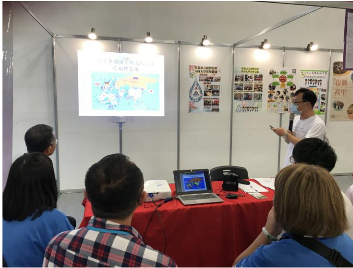
簡述國家間地理位置之重要性