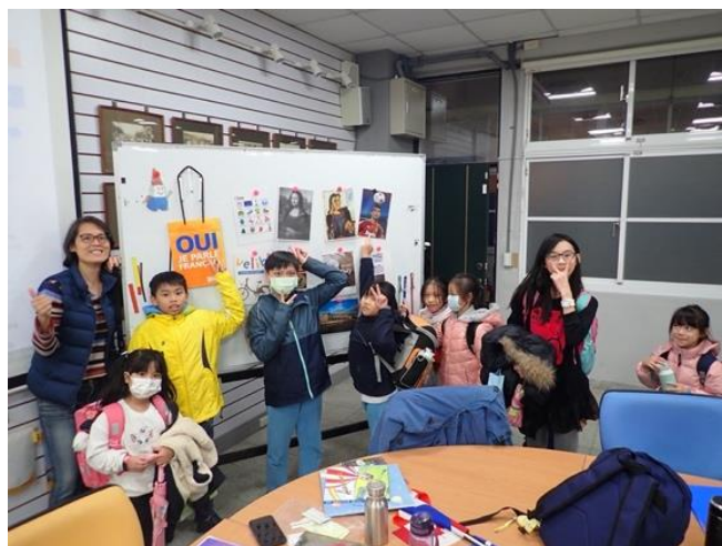
老師帶領同學們一起唱聖誕歌。