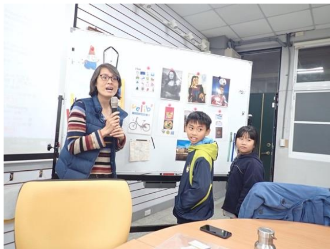
底下同學有其他的答案。