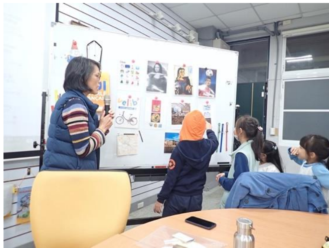
同學們上台進行搶答。