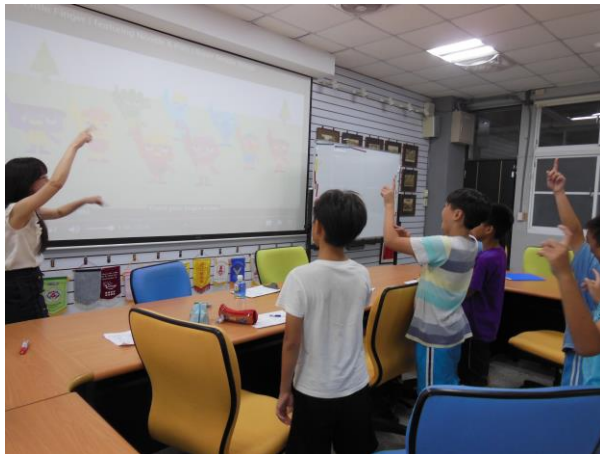
跟著歌謠一起舞動身體