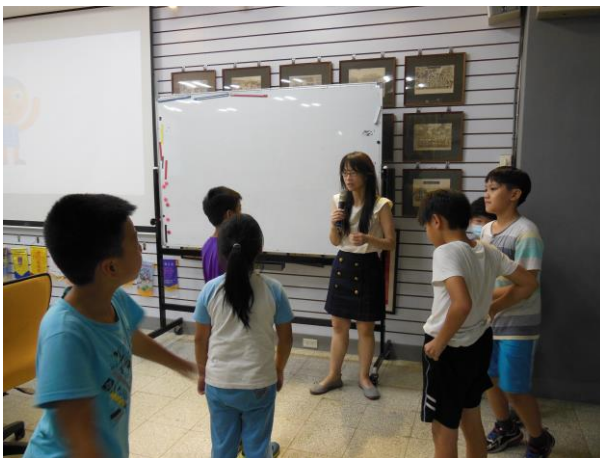
老師說明遊戲規則