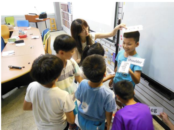
進行黏貼身體部位字卡遊戲