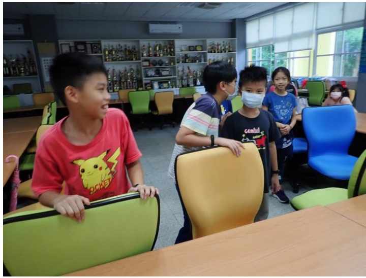
學生們彼此練習打招呼 的問候語