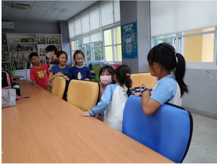
學生們彼此練習打招呼 的問候語