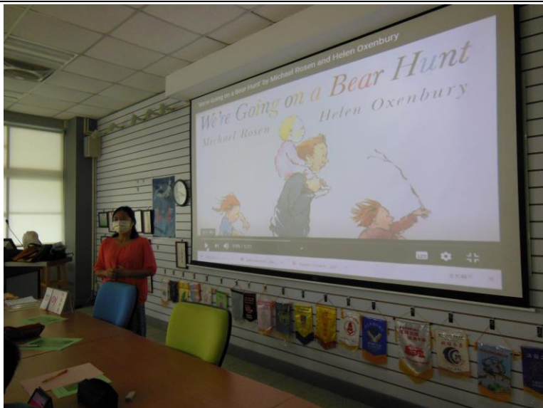
老師播放作者 Michael Rosen 說故事版本的 影片