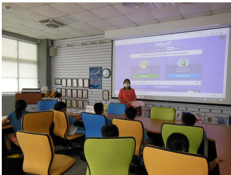
學生進行 Kahoot 遊戲