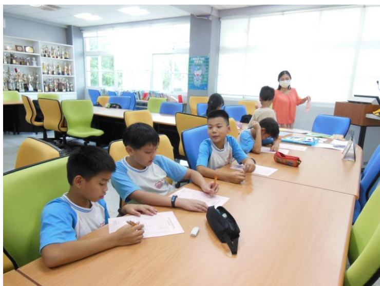
學生練習寫學習單