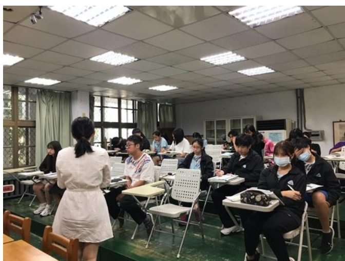
老師正等待同學回答問題。