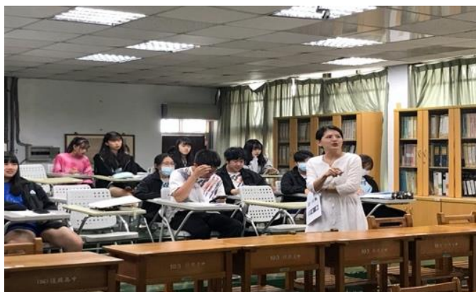
老師正在解說法國甜點由來。