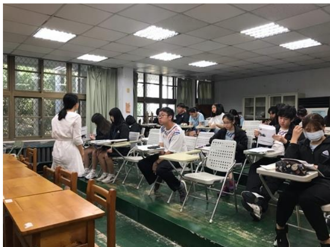
老師走下台與學生進行互動。