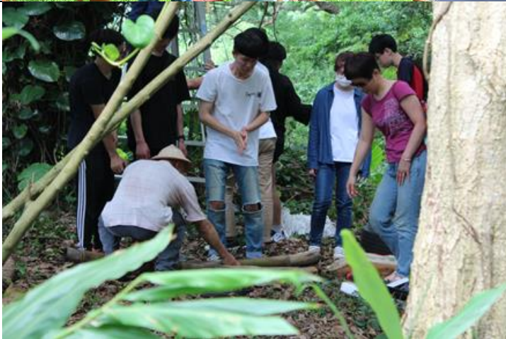
學生在園區進行園區街道家具設施實作。