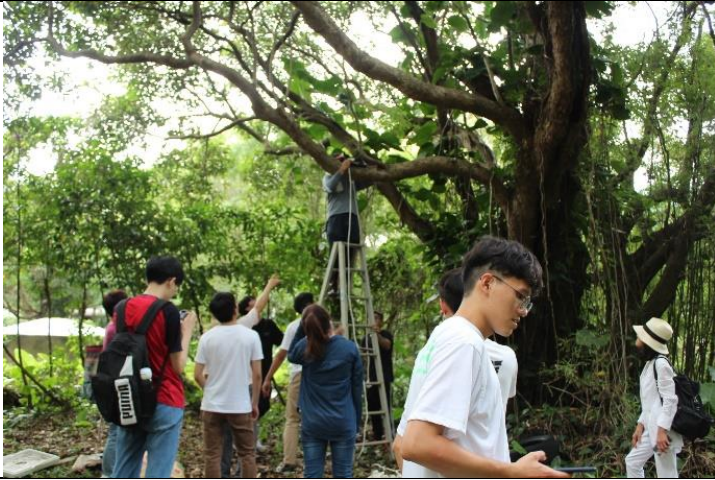
學生發揮互助精神輔佐彼此在園區進行園區街道家具地架設。