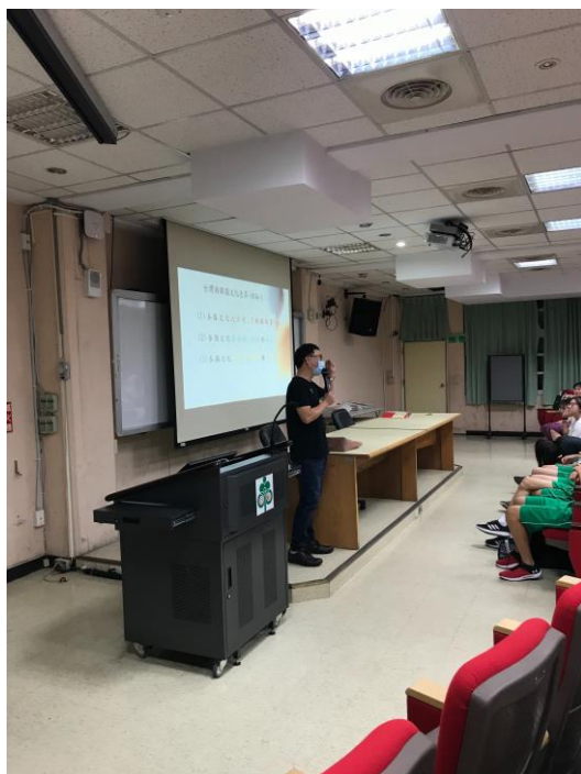
總結面對不同文化之態度