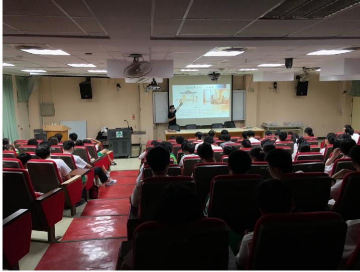
講解韓國特有的暖房