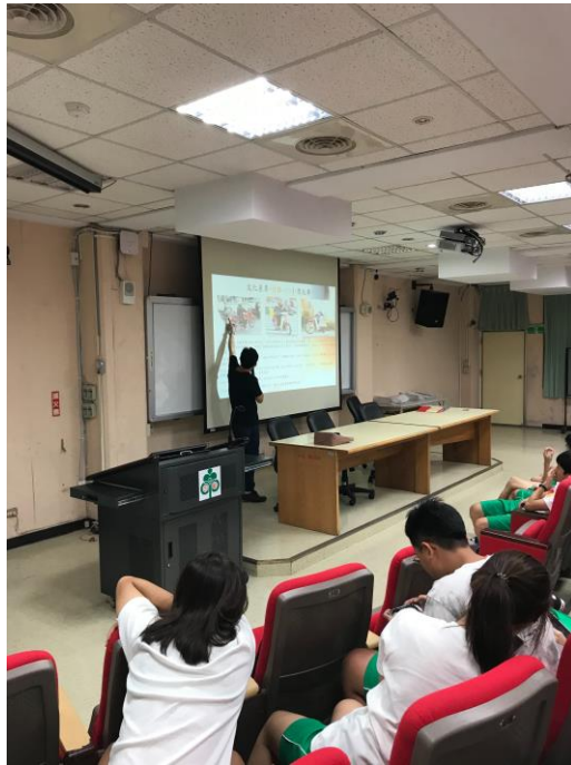
台韓交通工具的不同