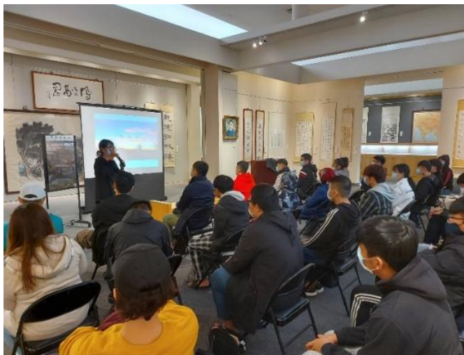
葉執行長鼓勵同學們探詢內心的追求，以定位自己的生活及未來。