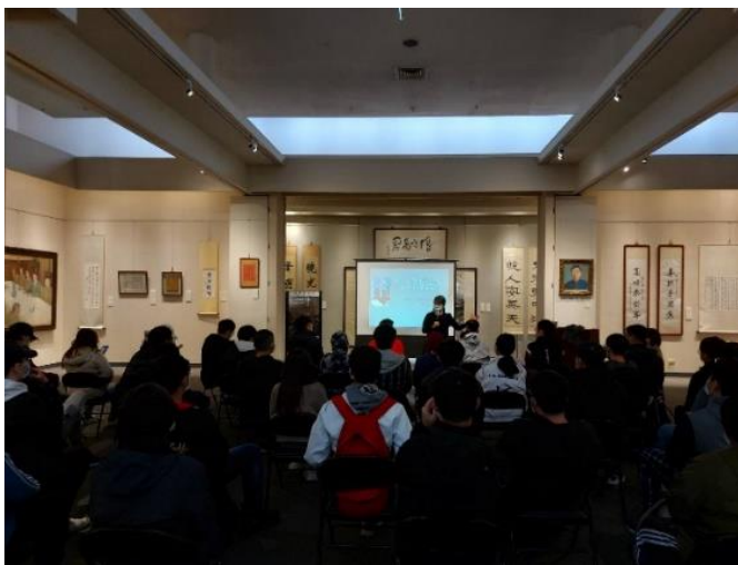
講座報名踴躍，滿場學生仔細聆聽葉執行長的分享。