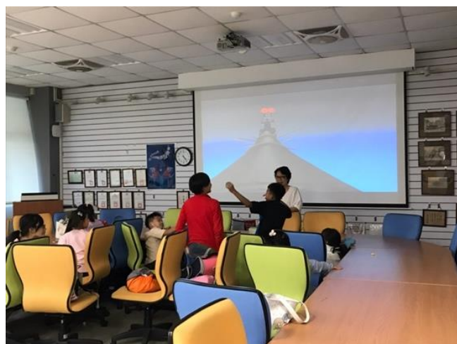
同學正勇於舉手回答問題。