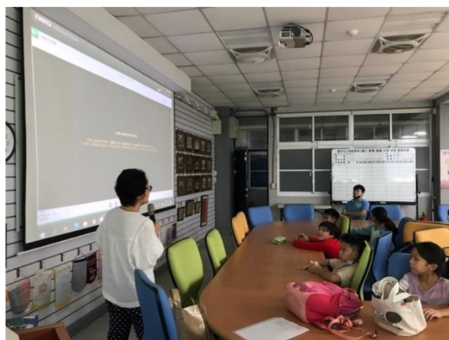
老師開始介紹影片內容。