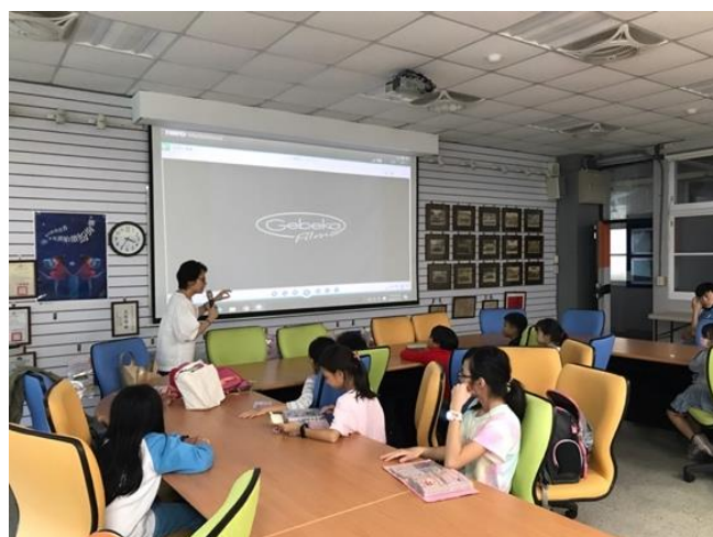
同學們正在專心聆聽影片介紹。