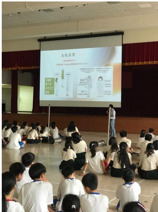
東西方穿著上的不同