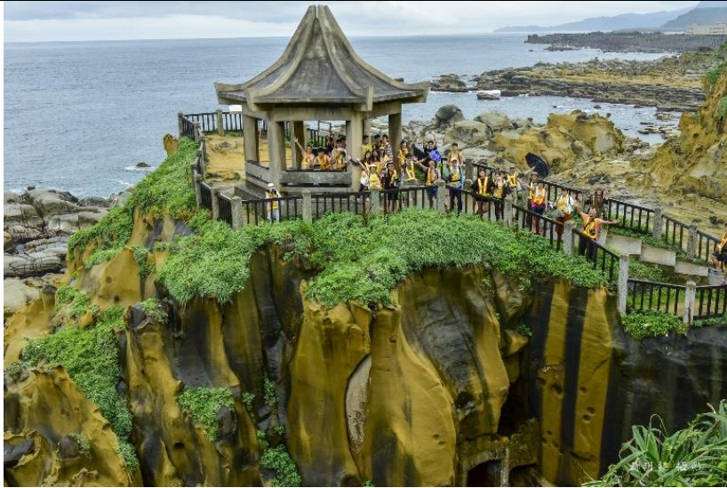
基隆和平島大合照