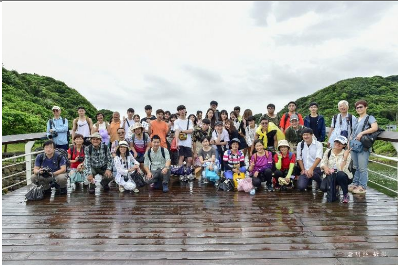
基隆和平島大合照