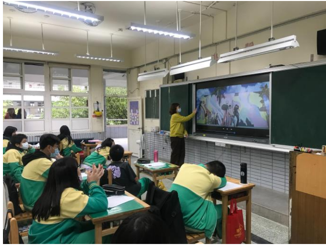
播放時下流行 音樂 BTS 的 Dynami te