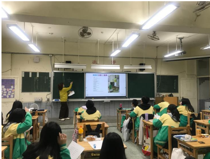
兒歌三隻熊歌 詞教學