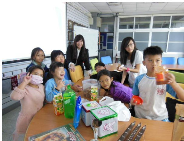
共同製作墨西哥披薩