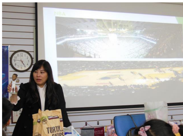
走訪 NBA 經驗分享