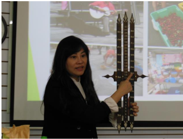
老師介紹從跳蚤市場帶 回，歷史悠久的月曆