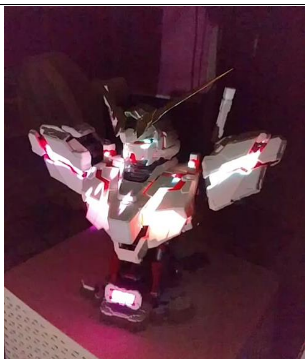
lightform creator 實作-1