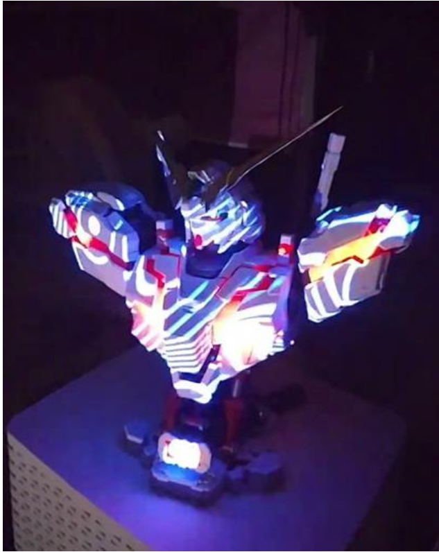
lightform creator 實作-2