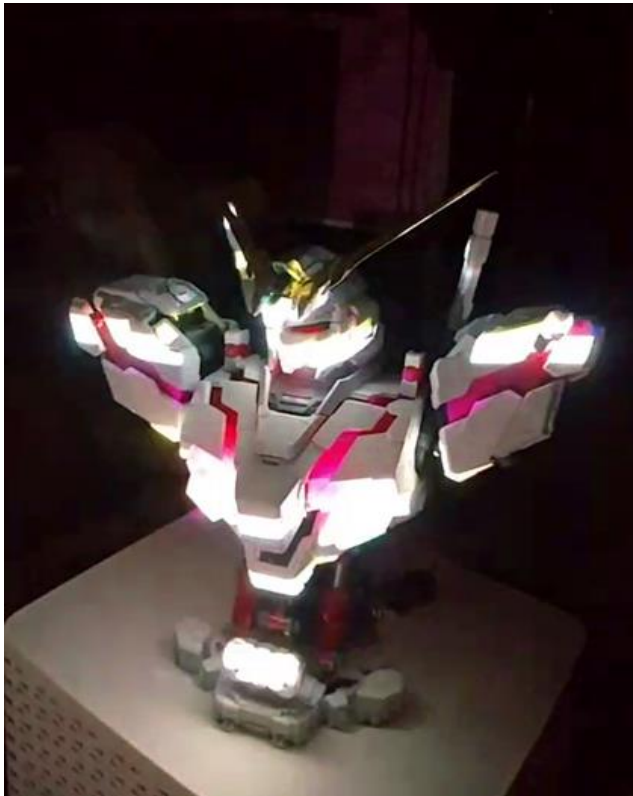
lightform creator 實作-3