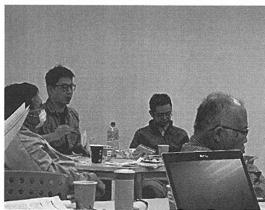
同學提出自身看法