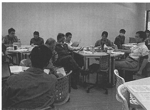
黃藹老師提出翻譯建議