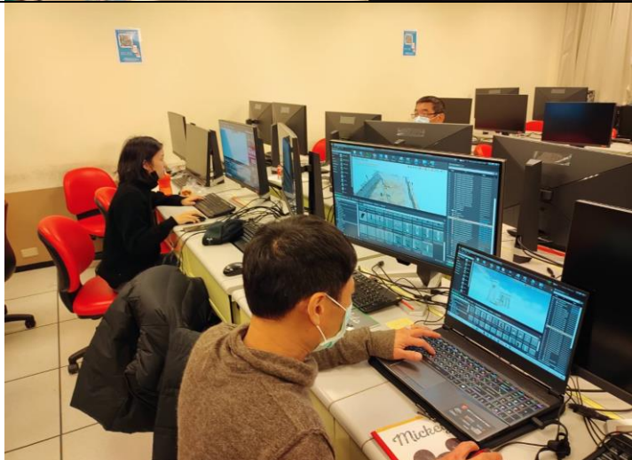
完成 VR 遊戲內容並且發布執行檔