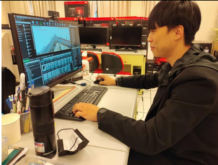
完成 VR 遊戲內容並且發布執行檔