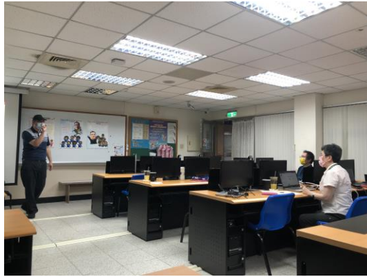
學員向主講者提問的過程