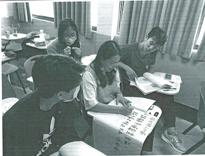
110年04月24日 工作坊實況