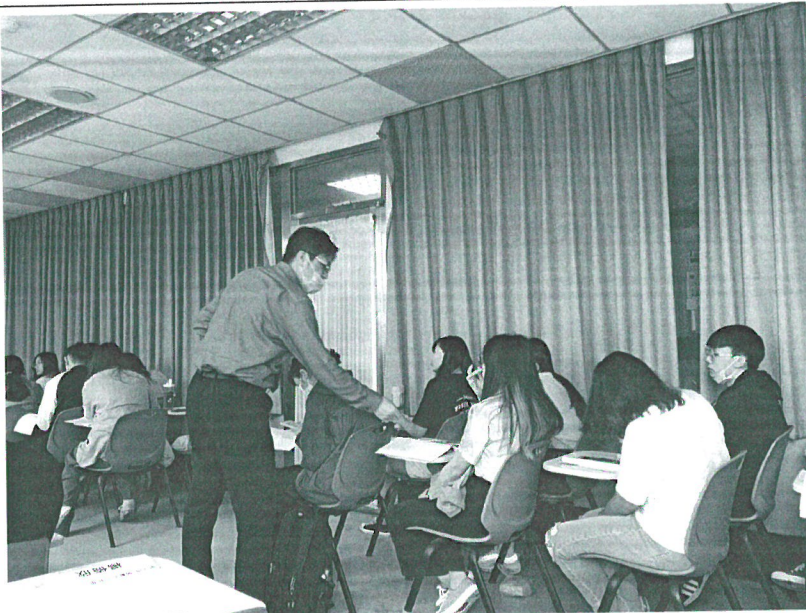
110年04月24日 工作坊實況