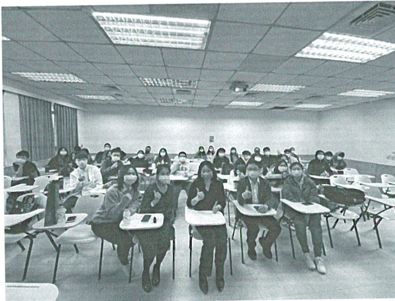
110年11月15日 講座實況- 演講後與學生合影