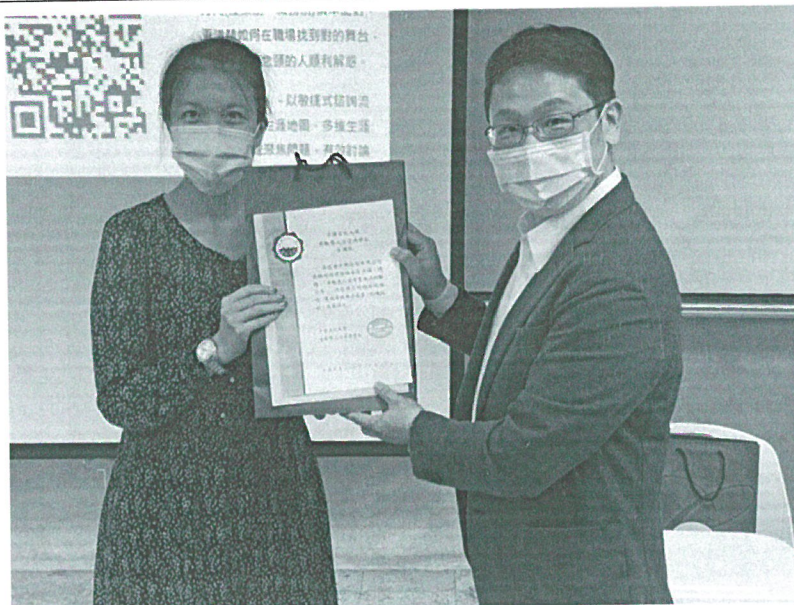
110年11月15日 講座- 致贈感謝狀