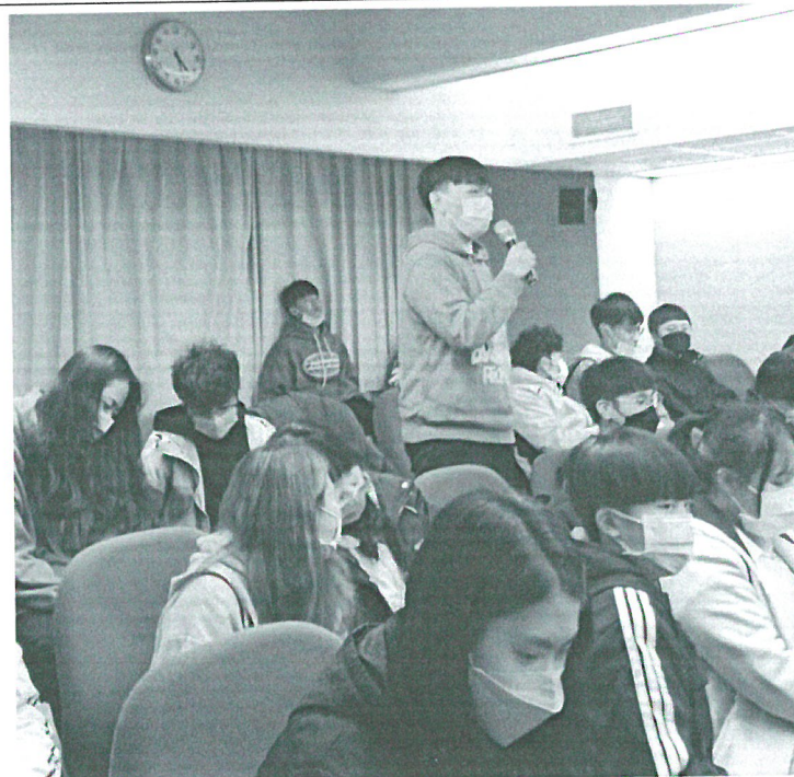
110年12月06日 講座- 學生與講者互動