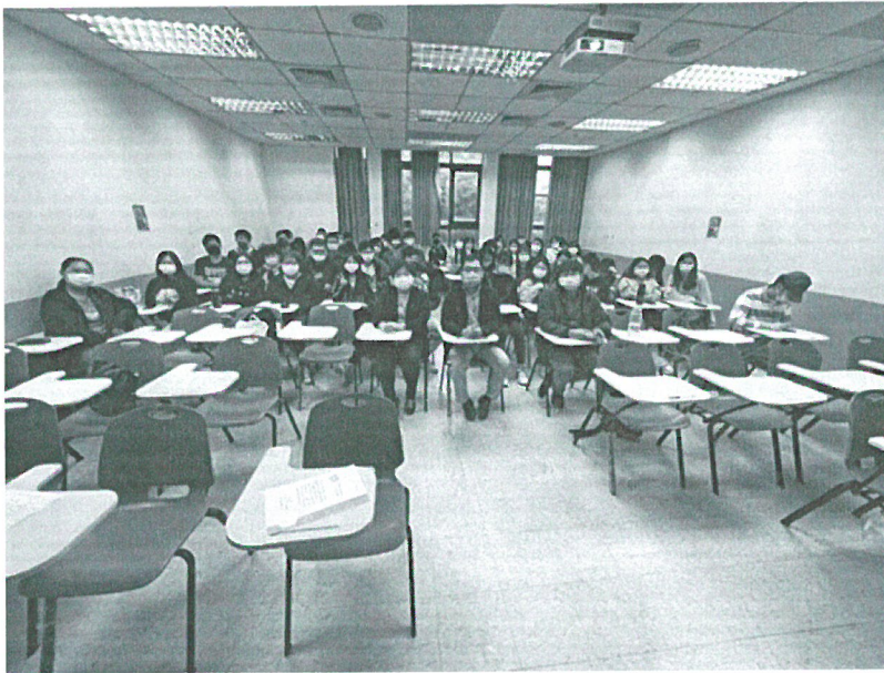
110年11月1日 講座後與參與 學生合影