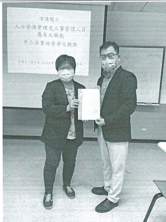
110年11月1日 講座- 致贈感謝狀