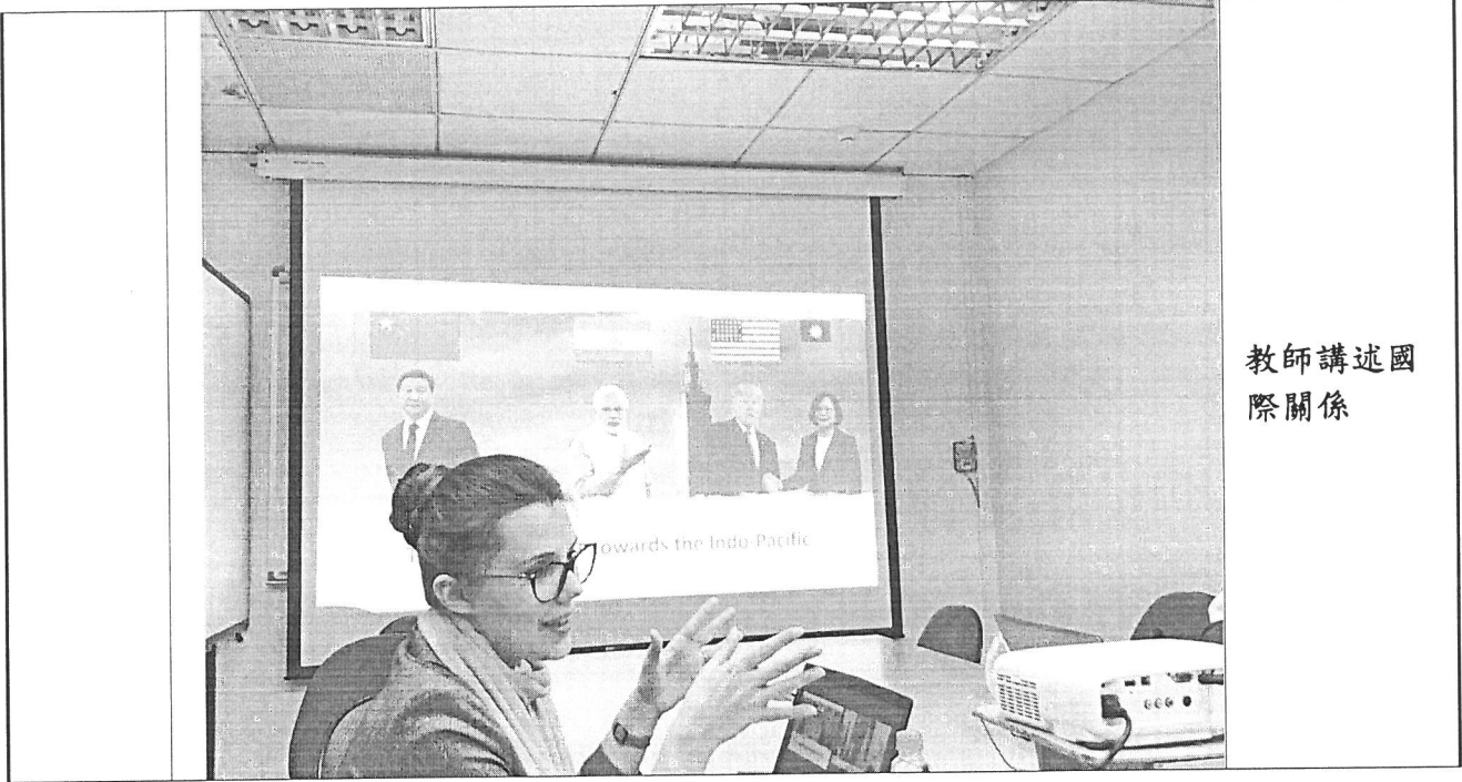
教師講述國際關係