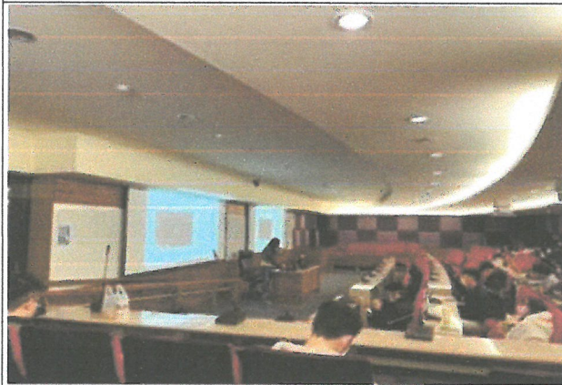
元棠老師，播放其曾經的作品。