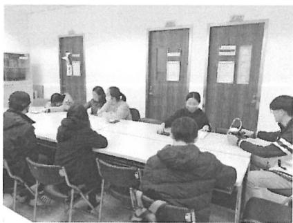
圖片 3 說明 學生聆聽演講情形