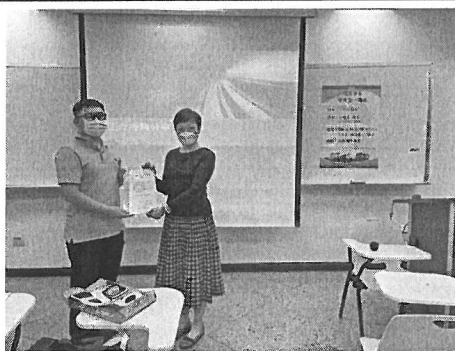
照片說明：頒發感謝狀。