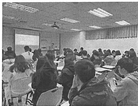
照片說明：學生聽講演講情形。