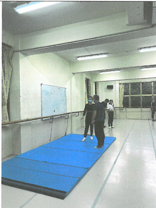
許孝存老師-「戲曲舞蹈 - 跳轉翻技巧」課程