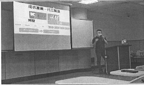
照片說明：講者演講情形。