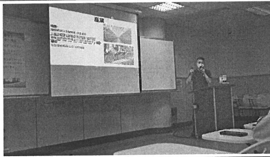
照片說明：講者演講情形。