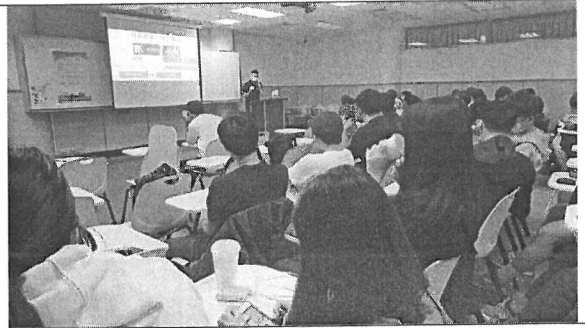
照片說明：學生聽講演講情形。