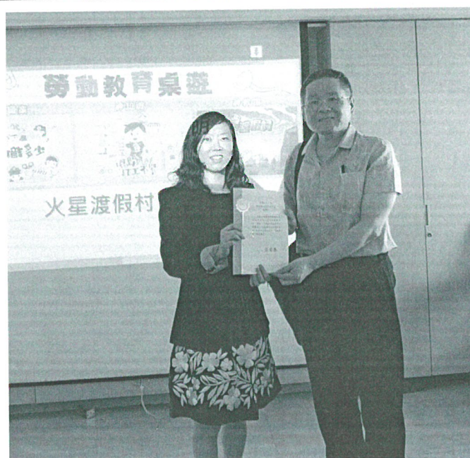
110年5月10日 講座- 致贈感謝狀