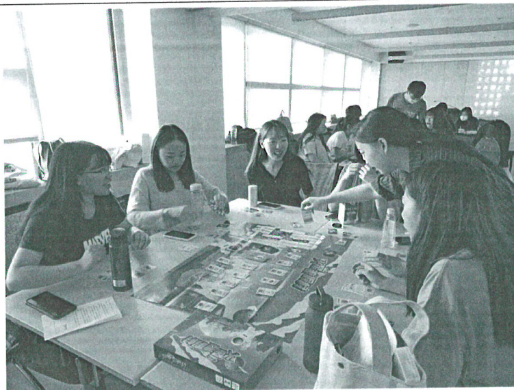
110年5月10日 講座實況- 學生體驗勞資關係 桌遊