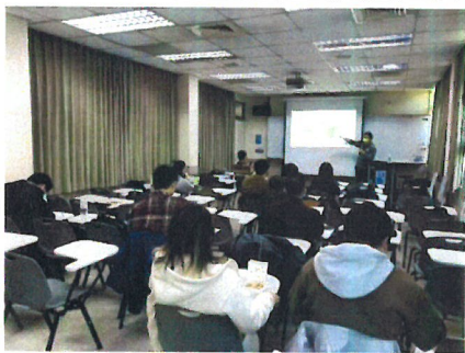
圖片 3 說明 學生聆聽演講情形