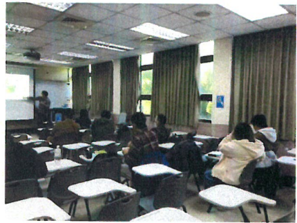
相關圖片 2 說明 學生聆聽演講情形