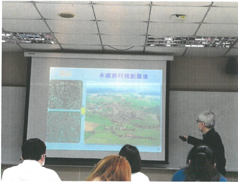
莊老達處長 向同學們分 享現況照片