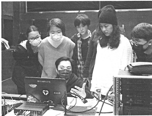
老師實際操作及分析線路表