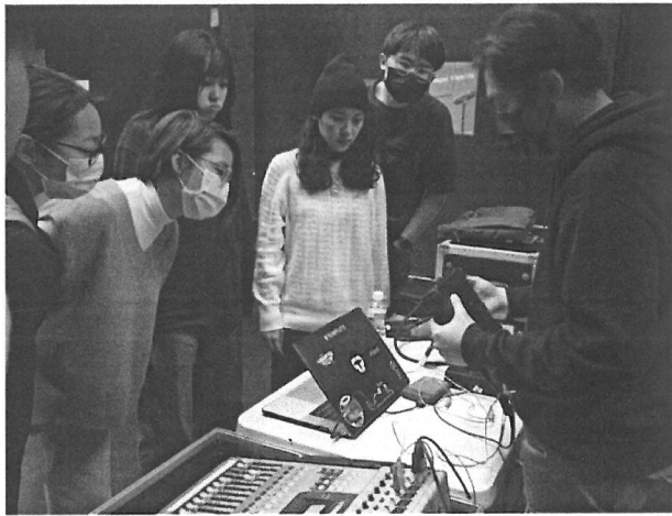
介紹音響輸出基本配置