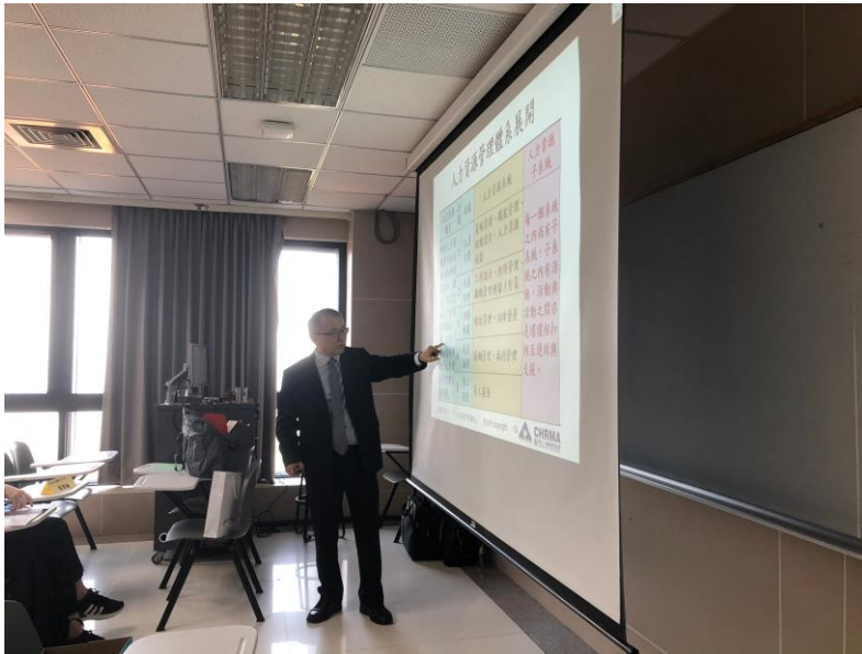
110年03月13日 工作坊實況