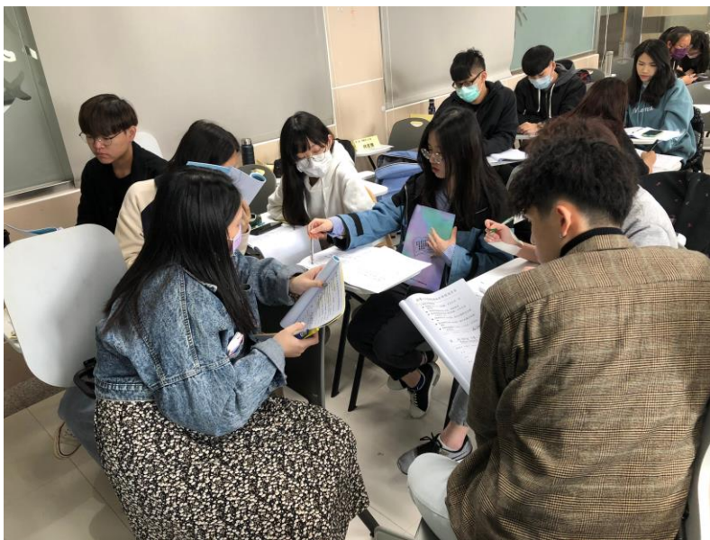
110年03月13日 工作坊實況