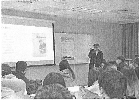
照片說明：講者演講情形。