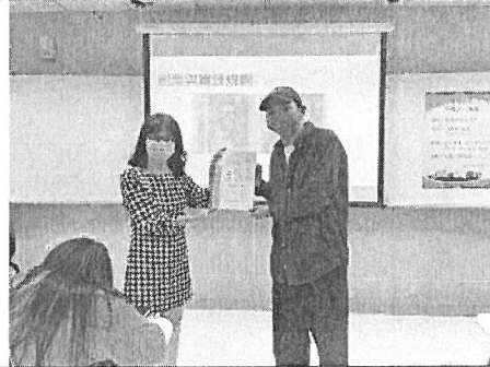
照片說明：頒發感謝狀。