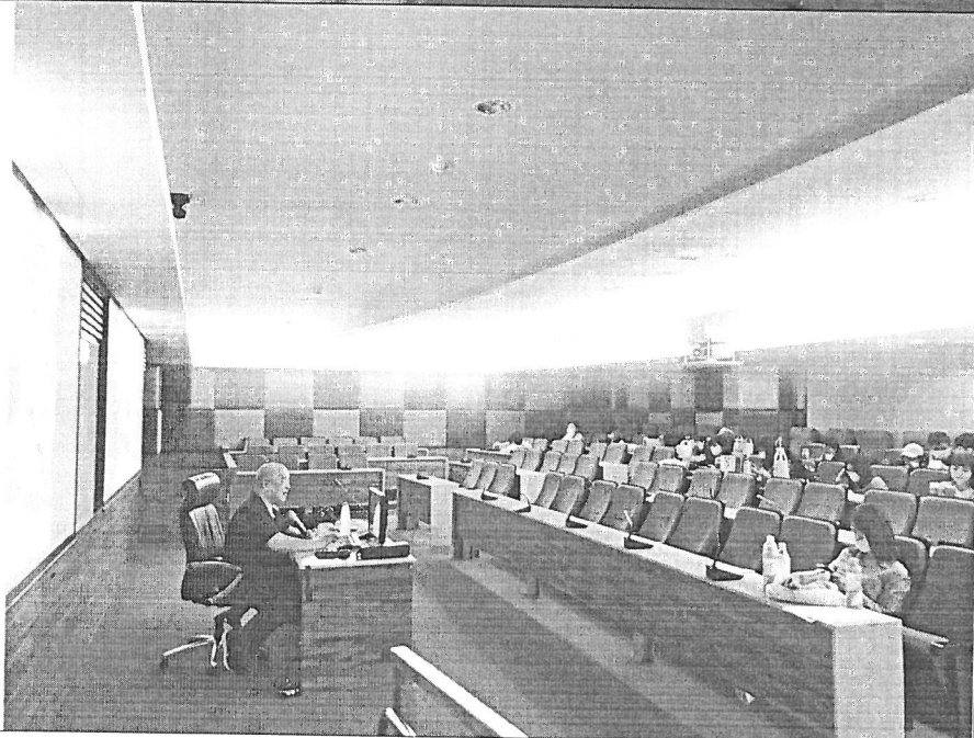
學生聽講互動狀況